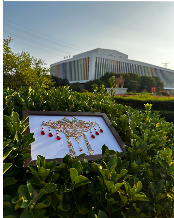
《云锦绕肩》 21 高职班杜宇清 舒梦姚