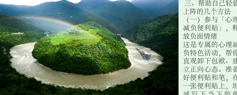
23 大好河山

三、帮助自己轻装上阵的几个方法 (一) 参与「心理减负便利贴」，释放负面情绪 这是专属的心理减负特色活动，帮你直观卸下包袱、建立正向心态。准备好便利贴和笔，在一张便利贴上，坦诚写下当下的焦